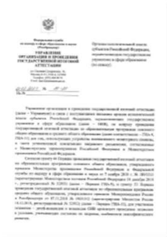
Письмо Федеральной службы по надзору в сфере образования и науки от 01.02.2023 №10-21

ЭЛЕКТРОННОЕ УСТРОЙСТВО ИСПОЛЬЗУЕТСЯ ТОЛЬКО В КАЧЕСТВЕ ПРИСПОСОБЛЕНИЯ ДЛЯ НЕИНВАЗИВНОГО МОНИТОРИНГА ГЛЮКОЗЫ